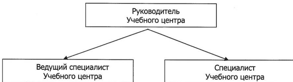
Схема организационной структуры Учебного центра